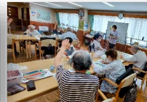
おとなの学校（月・金・土）