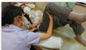
理学療法士による個別リハビリ

【町田市】 成瀬台・成瀬・西成瀬・南成瀬・成瀬が丘 つくし野(1~4丁目)・南つくし野(1~4丁目) 小川(1~7丁目)・金森東(1~4丁目) 高ヶ坂(1丁目一部、3~7丁目)・本町田 南大谷(1~1700)・森野・旭町 玉川学園(1~4丁目)・金森・鶴間 原町田(3~6丁目)・中町(1~4丁目) 【横浜市青葉区】 奈良(1~5丁目)・奈良町・恩田町 ※上記の場所以外はご相談ください