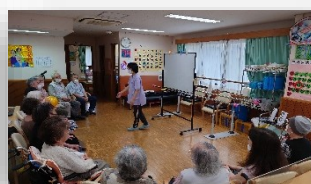
小集団（歌の会/火・木）