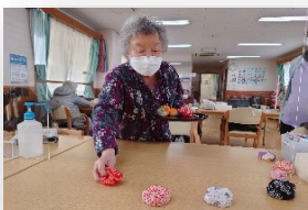
作業療法士による個別リハビリ