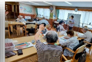
おとなの学校（月・金・土）