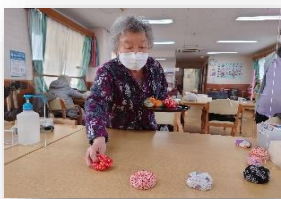
作業療法士による個別リハビリ