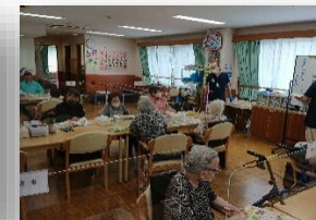
おとなの学校（月・金・土）