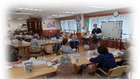
おとなの学校（月・金・土）