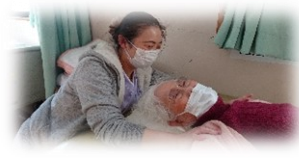
作業療法士による個別リハビリ