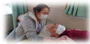
作業療法士による個別リハビリ