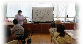
おとなの学校(月・金・土)