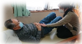
理学療法士による個別リハビリ