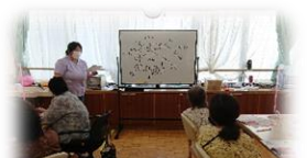
おとなの学校（月・金・土）