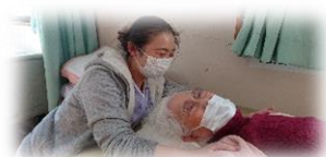
作業療法士による個別リハビリ