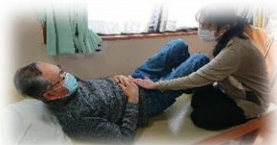
理学療法士による個別リハビリ