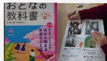
おとなの学校（月・火・金・土）※3月より火曜日も実施