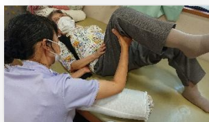
理学療法士による個別リハビリ

【町田市】 成瀬台・成瀬・西成瀬・南成瀬・成瀬が丘 つくし野(1~4丁目)・南つくし野(1~4丁目) 小川(1~7丁目)・金森東(1~4丁目) 高ヶ坂(1丁目一部、3~7丁目)・本町田 南大谷(1~1700)・森野・旭町 玉川学園(1~4丁目)・金森・鶴間 原町田(3~6丁目)・中町(1~4丁目) 【横浜市青葉区】 奈良(1~5丁目)・奈良町・恩田町 ※上記の場所以外はご相談ください