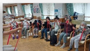
小集団（歌の会/木） ※3月より木曜日のみ実施