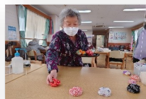
作業療法士による個別リハビリ