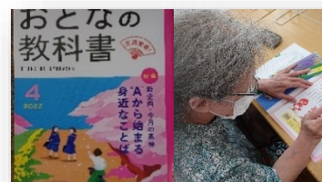
おとなの学校（月・火・金・土）※3月より火曜日も実施