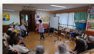
小集団（歌の会/木） ※3月より木曜日のみ実施