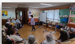
小集団（歌の会/火・木）