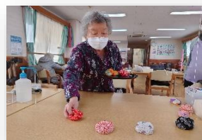
作業療法士による個別リハビリ