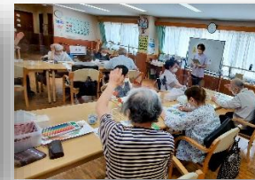
おとなの学校（月・金・土）